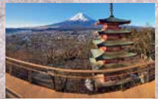
眺めて楽しむ富士山 (新倉山浅間公園)