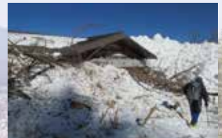
雪代の被害を受けた大沢休憩所